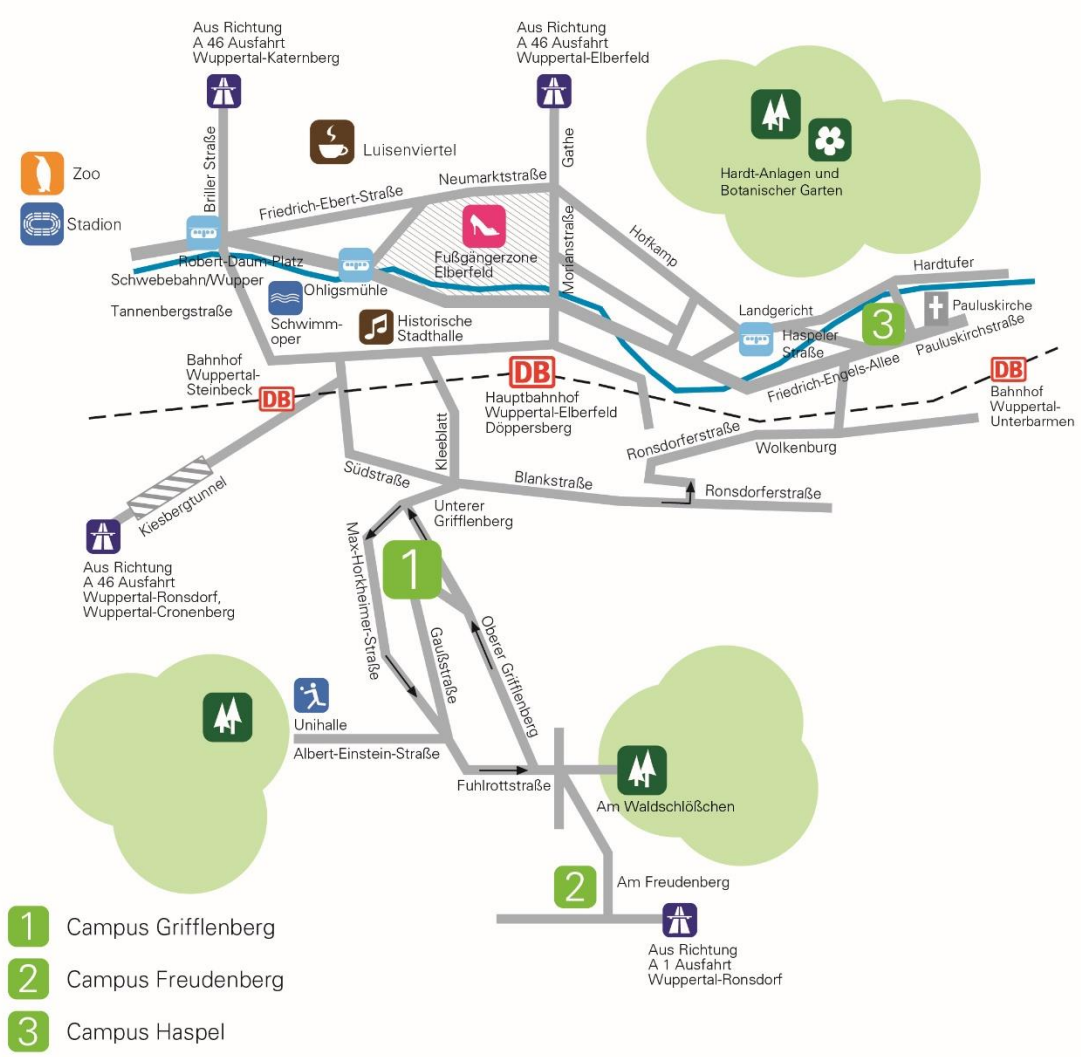
Abb.: Lage der Standorte in Wuppertal